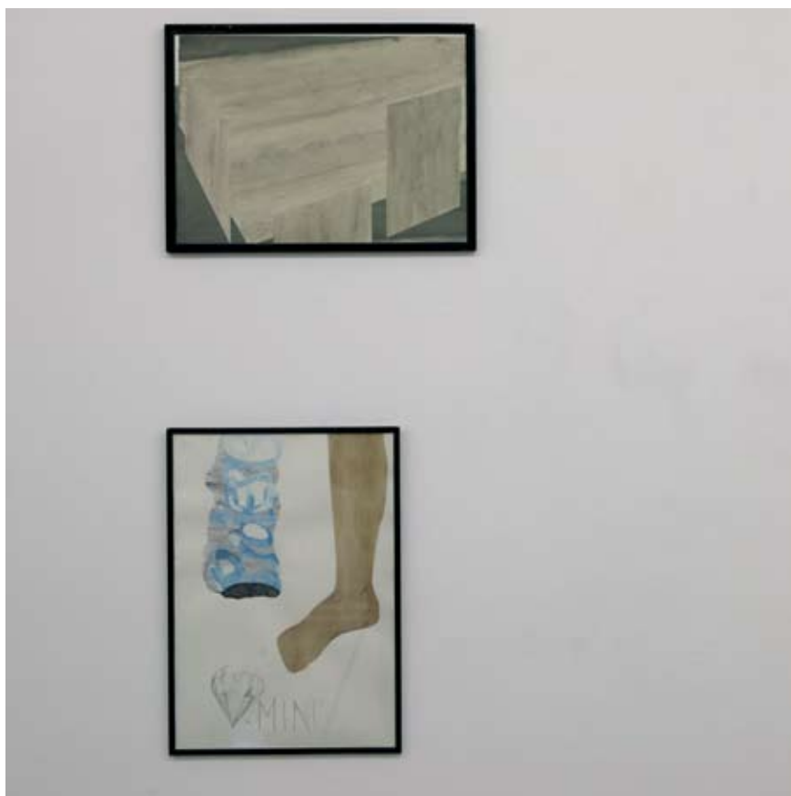
"Mine", diptiek van aquarellen, 147 x 50 cm

droomgevoel aan de doodnuchtere realiteit. Dat volksmensen bij die beelden aansluiting vinden met zowel hun paradijsdromen als hun harde bestaan, belet niet dat ze tegelijk zuiver artistieke inhoudten vertolken.