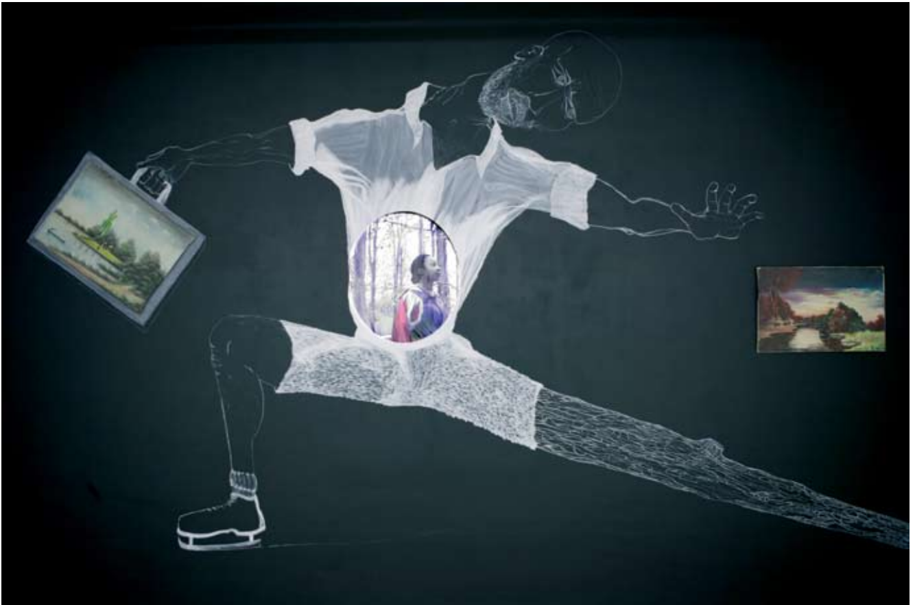
"Black Star", muurschildering, video, schilderijen, 450 x 550 cm